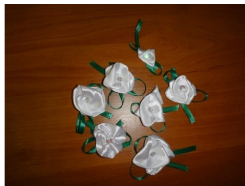
Рис. 7. Белые цветки, изготовленные участниками благотворительного проекта

В общей сложности в подготовленных мероприятиях приняли участие 83 человека из МБОУ гимназия № 161 (обучающиеся, педагоги, родители).