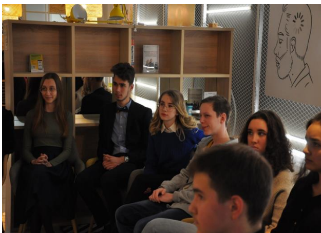
Рис. 9. Участники реализации проекта