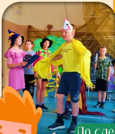
По следам Пушкинских сказок