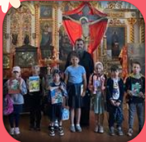
Храм «Петра и Павла»