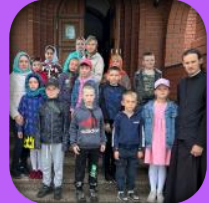
Храм «Спиридона Тримифунтского»