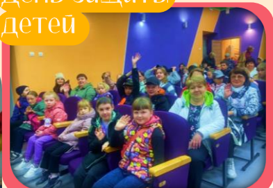
День защиты детей