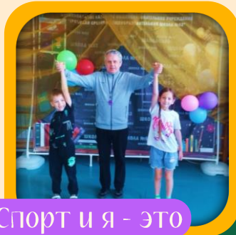
«Спорт и я - это крепкая семья»