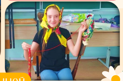
Песни в военной шинели