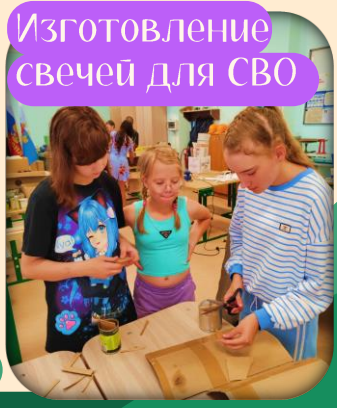
Изготовление свечей для СВО