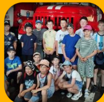
Пожарная часть №86