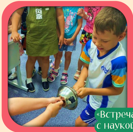
«Встреча с наукой»