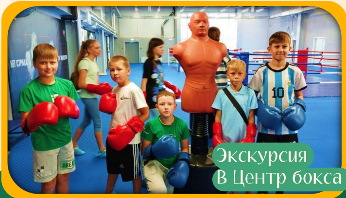
Экскурсия В Центр бокса