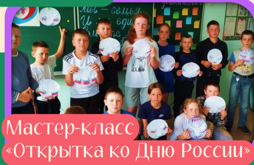
Мастер-класс «Открытка ко Дню России»