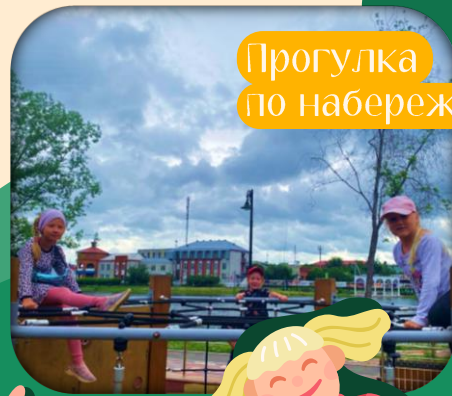
Прогулка по набережной