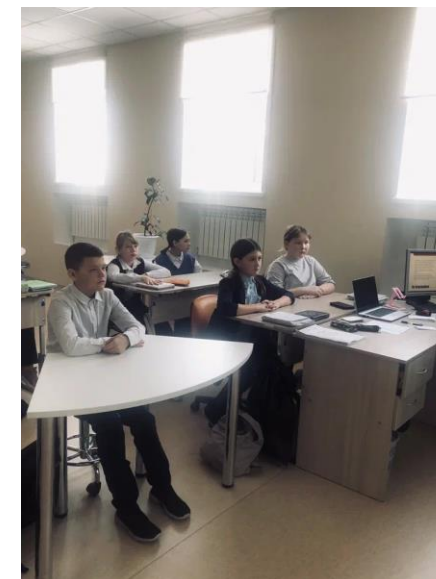
Технология креативного мышления