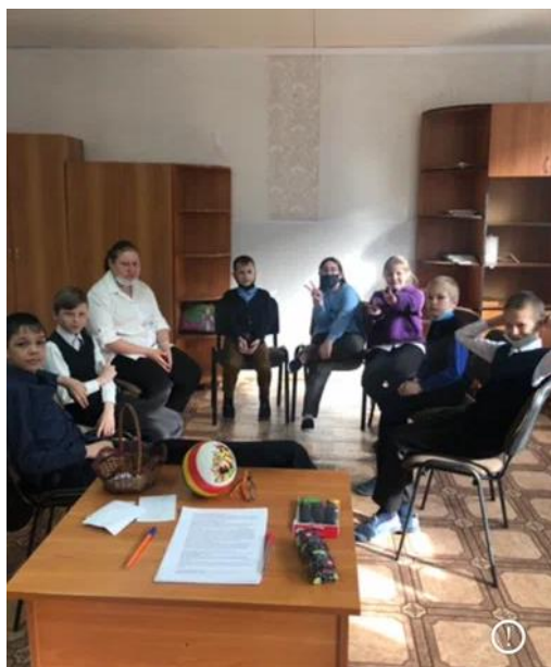
Уроки с элементами тренинга