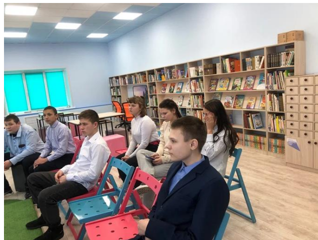
Экскурсии. «Библиотечный час»